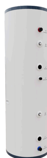
Caelio SR 200 HP