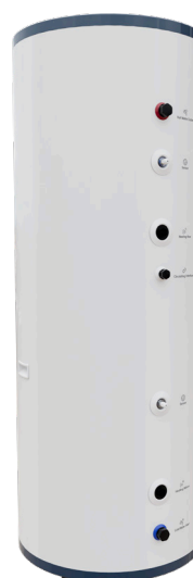
Caelio SR 300 HP