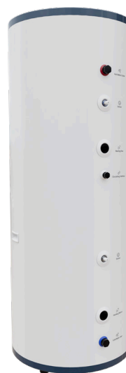
Caelio SR 300 HP