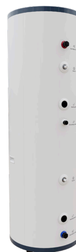
Caelio SR 200 HP