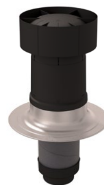
Soluzione per tetti piani