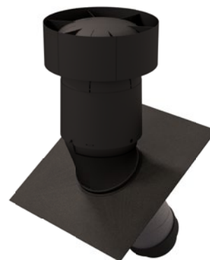
Soluzione per tetti inclinati con attraversamento perpendicolare